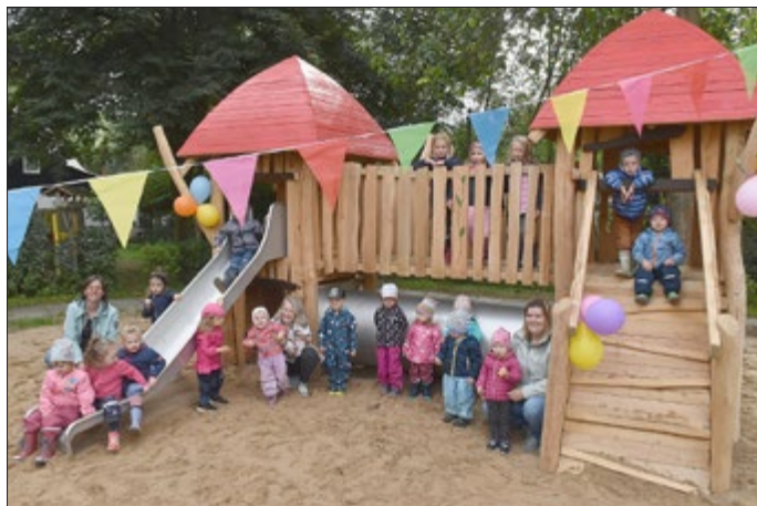
Die Kinder und ihre Erzieherinnen freuen sich über die neuen Wichteltürme im Kindergarten Wendehausen.

Spätestens nach der Winterpause laden die Wichteltürme die Kinder wieder zu fröhlichen Versteck-, Kletter- und Rollenspielen ein.