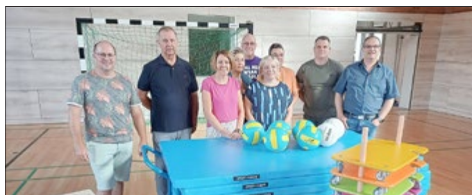
Text und Foto: Reiner Schmalzl

Sport- und Spielgeräte im Gesamtwert von mehr als 10.000 Euro haben die beiden Fördervereine der Thüringer Gemeinschaftsschule in Heyerode den Mädchen und Jungen für Sport und Freizeit in der Turnhalle und im Hort zur Verfügung gestellt. Vor der Neuwahl der Fördervereine haben die bisherigen Vereinsvertreter die neuen Sport- und Spielgeräte symbolisch übergeben.