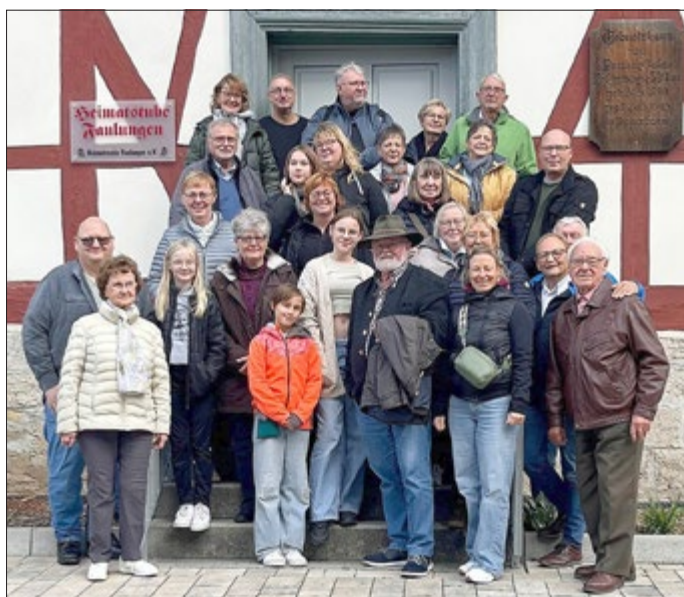
Gruppenfoto von einigen Mitgliedern beider Vereine