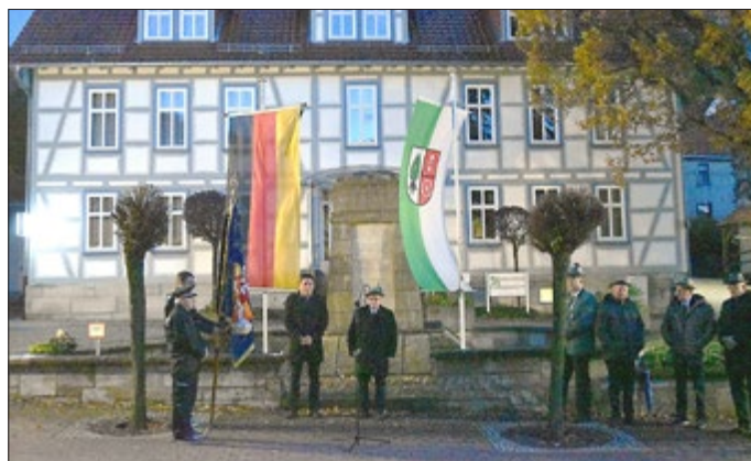
Feierliches Gedenken am Ehrenmal für die Opfer der beiden Weltkriege in Heyerode